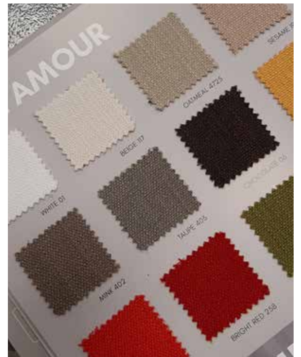
I dettagli dei tessuti e dei ricami customizzati realizzati da Stile Casa 4.0